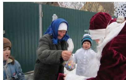
Коляде были рады в каждом дворе