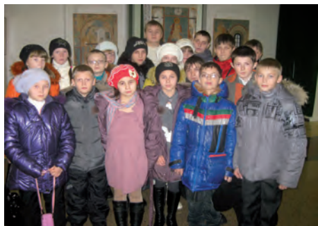
Дети Шацкой Воскресной школы

Попасть на Рождественскую Патриаршую елку в Москве – это мечта каждого ребенка. По приглашению руководства храма Христа Спасителя 14 января 2012 года Рождественское представление в Москве посетили дети Воскресной школы Свято-Успенского Вышенского монастыря и Воскресной школы г. Шацка. Путешествие было не из легких, так как до Москвы по снежным дорогам нужно было преодолеть 400 км. Но дети в ожидании рождественского чуда и с молитвенными песнопениями преодолели это расстояние. Многие из них никогда не были в Москве. Когда автобус выехал на набережную, и дети увидели величественный Кремль, в руках у всех сразу появились фотоаппараты и мобильные телефоны, чтобы запечатлеть красоту и великолепие нашей столицы.