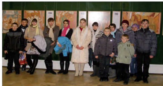
Дети монастырской Воскресной школы

Затем детей проводили в зал Церковных соборов, где и состоялось праздничное представление, повествующее о Рождественском чуде, которое произошло в Вифлеемской пещере много лет назад. Чувство радости переполняло детские сердца от чудесного сказочного действия, которое сопровождалось русскими народными песнями и святочными песнопениями. С рождественскими подарками дети увозили домой яркие воспоминания о том, как весело и дружно все славили рожденного Христа. Как бы ни сложилась их взрослая жизнь, каждый из них сохранит в сердце память о своем рождественском чуде.