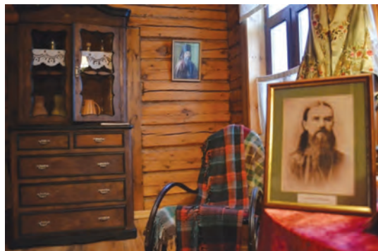
Келья свяtitеля Феофана

В январе есть и еще одна дата, связанная с памятью Феофана Затворника. 23 января (по ст. ст. 10 января), в день рождения свяtitеля Феофана, Церковь отмечает день его памяти.