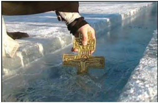
Чин освящения воды