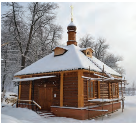
Купель на источнике Казанской Божией Матери