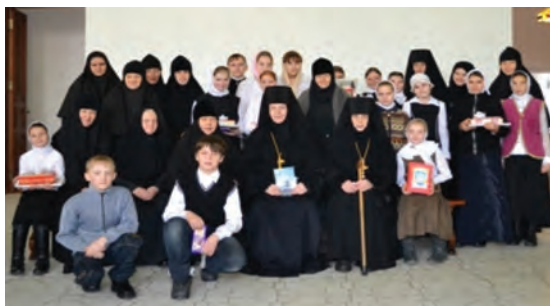
Дети и матушки

Свято-Варсонофиевский женский монастырь был основан в 1996 году на месте обычного прихода, в селе Покровские Селищи Zubovo-Полянского района Республики Мордовии. С самого возникновения обители сестры приняли под свой кров малолетних их к хозяйству и разным руко-Варсонофьевского монастыря чатье. Их приезд всегда радость для В этот раз дети приехали на Вышу сестер, но и приложиться к молиться и причаститься. Во время пели на клиросе. После службы представление, они изготовили ле, а также кукол, которыми сами чек. Во время представления дети песнопения. На сцене маленького стов разворачивались великие события, которые произошли 2012 лет назад.