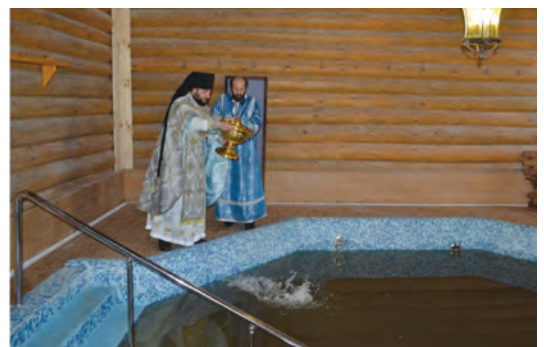
Освящение купели на источнике Казанской Божией Матери

обычаю, купание представляет собой троекратное погружение в воду с головой. При этом верующий крестится и произносит: «Во имя Отца, и Сына, и Святого Духа!» Обычно для купания используют длинные рубашки, в которых совершается погружение, наподобие крестильных. Они одинаковы для мужчин и для женщин. Считается, что если прихожане одевают в купальники, то телеса, выставляемые напоказ, диссоннируют с традиционной христианской благопристойностью.