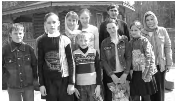
На святом источнике в Дивеевской обители

После трапезы состоялась экскурсия, во время которой дети узнали много нового о святой обители. По окончании экскурсии у ребят появилось желание еще раз пройти по канавке более осознанно и молитвенно. После посещения храмов обители и поклонения святым мощам все отправились на святой источник Серафима Саровского. Многие из ребят искупались. Домой все вернулись с новыми богатыми впечатлениями.