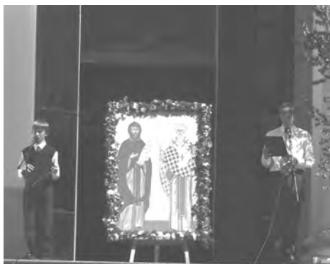
Празднование Дня славянской письменности и культуры в Вышенской обители

ЯКО АПОСТОЛОМ ЄДИНОПРАВНИИ И СЛОВЕНСКИХ СТРАН УЧИТЕЛИЕ, КИРИЛЛЕ И МЕФОДИЕ БОГОМУДРИИ, ВЛАДЫКУ ВСЕХ МОЛИТЕ, ВСЯ ЯЗЫКИ СЛОВЕНСКИЯ УТВЕРДИТИ В ПРАВОСЛАВИИ И ЄДИНОМЫСЛИИ, УМИРИТИ МИР, И СПАСТИ ДУШИ НАША.