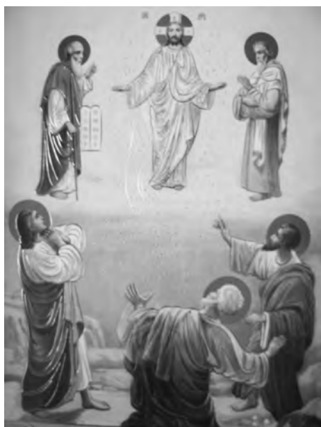
Преображение Господа Иисуса Христа

Святитель Феофан Затворник Вышенский 6 августа 1863 г.