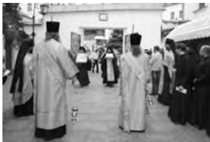
Святыни в Киево-Печерской Лавре

В августе началась третья часть крестного хода с частицей мощей святителя Феофана Затворника Вышенского и Чудотворной Казанской иконой Божией Матери по местам служения святителя, посвященного 200-летию со дня его рождения. Крестные ходы уже были совершены во Владимирскую и Тамбовскую епархии. На этот раз путь крестного хода лежал в Киев, в Киево-Печерскую Лавру, – место учебы святителя Феофана. Именно здесь в Киевской академии студент Георгий Говоров развил в себе способности и любовь к писательству. 15 февраля 1841 года был совершен чин пострижения Георгия Васильевича Говорова в монашество с именем Феофан. Постриг состоялся в Свято-Духовской церкви Киево-Братского монастыря. Вскоре после пострижения монах Феофан был представлен святителю Филарету (Амфитеатрову), митро-